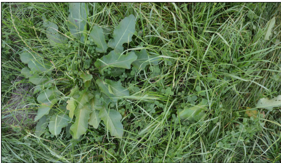
Rumex obtusifolius Pflanze Eigene Darstellung