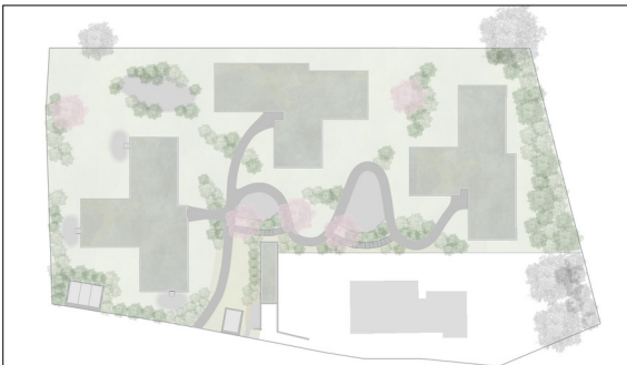
Der Ortsbetonweg schlängelt sich den Hang hinauf und durchschneidet die vorhandenen Strauchgruppen. Eigene Darstellung

Ziel der Arbeit: Für die neu gebaute Siedlung soll anhand einer Ortsanalyse ein schlüssiges Konzept für die Aussenraumgestaltung erarbeitet werden. Daraus werden auf der Stufe des Vorprojektes die grundlegenden Gestaltungselemente, die Raumaufteilung und die Möblierung erarbeitet. Anhand von einem Detailausschnitt und von Leitschnitten werden die technischen Anforderungen vertieft untersucht. Dabei spielen zwei Faktoren eine besondere Rolle. Nämlich die Lage am Hang und die Aussicht auf den Zürichsee. Innerhalb des Perimeters ist eine Höhendifferenz von ca. 12 Metern zu überwinden und die Aussicht auf den See darf durch grössere Gehölzstrukturen nicht beeinträchtigt werden.